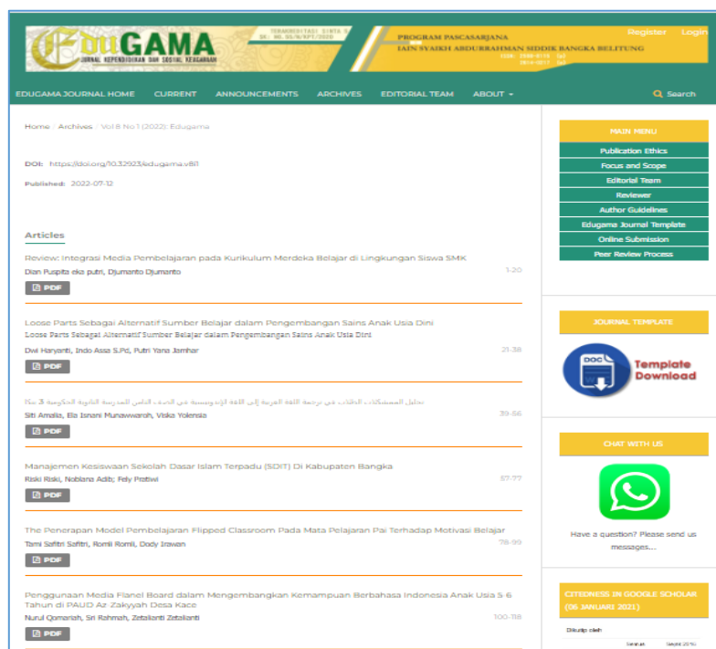
Gambar 2: Publikasi Artikel di Jurnal Edugama

Enam naskah artikel yang telah disubmit tersebut sudah dipublikasikan di jurnal Edugama volume 8 nomor 1 tahun 2022. ( https://jurnal.lp2msasbabel.ac.id/index.php/edu/issue/view/173 )