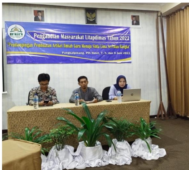
Gambar 1 Pembukaan kegiatan pengabdian

Penyampaian beberapa materi dasar terkait penulisan artikel ilmiah dilakukan untuk memberikan dasar pengetahuan bagi para guru dan mahasiswa sebagai peserta dalam kegiatan pendampingan penulisan artikel ilmiah ini. Kegiatan ini diperlukan agar mereka sudah memiliki pengetahuan dasar untuk mengembangkan tulisan atau penelitian mereka ke dalam bentuk artikel ilmiah yang baik dan siap dipublikasikan pada jurnal ilmiah.