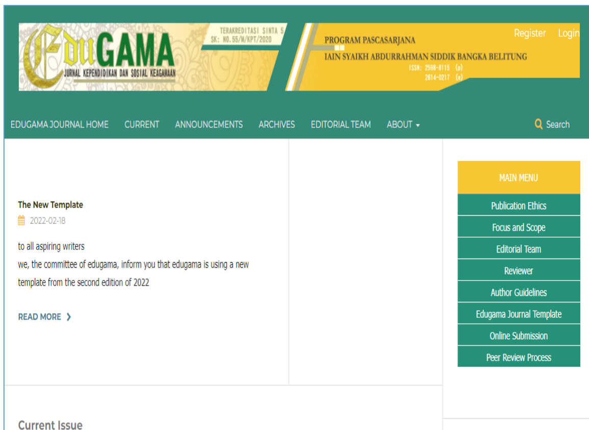
Gambar 1: Laman Jurnal Edugama Sinta 5

Enam naskah artikel yang telah disubmit tersebut sudah dipublikasikan di jurnal Edugama volume 8 nomor 1 tahun 2022. ( https://jurnal.lp2msasbabel.ac.id/index.php/edu/issue/view/173 )