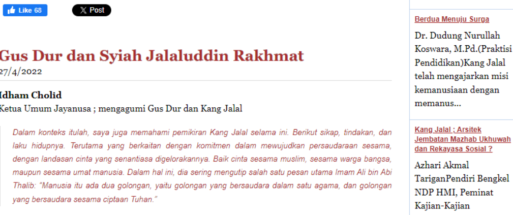
Gambar 4

Mengacu kepada fakta dokumentasi konten-konten yang dimuat oleh dua ormas syiah Indonesia tersebut, strategi framing yang digunakan oleh sudut pandang media syiah tersebut secara umum menggiring opini bahwa syiah terus hadir bersama membela kesetiaan terhadap pemerintah Indonesia. Media syiah Indonesia berupaya menampilkan kedekatan ormas syiah Indonesia dengan ormas Islam sunni serta pemerintah Indonesia. Alih-alih mengcounter propaganda kampanye anti syiah, media syiah lebih cenderung membangun framing kedekatan syiah dengan lembaga agama otoritatif Indonesia. Sejauh pelacakan penulis hampir tidak ditemukan suatu konten yang secara eksplisit menyinggung gerakan anti-syiah yang sering kali disebar oleh kalangan ultra-sunni garis kanan.