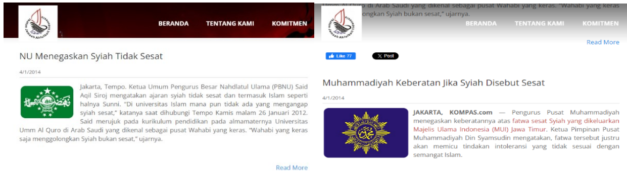
Gambar 3

Pancasila Tidak Bertentangan dengan Ajaran Islam